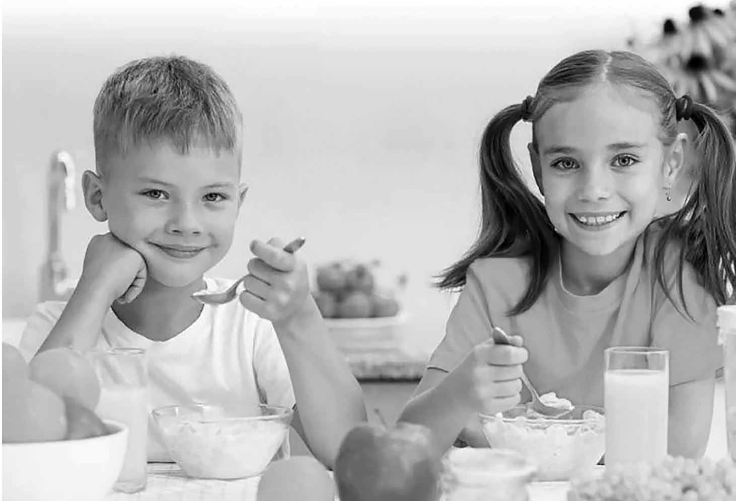
Для здоровья ребенка очень важно правильное питание

Родители, причем оба, несут ответственность за жизнь и здоровье ребенка. Как они могут повлиять на его пищевое поведение? Изменить образ жизни всей семьи.