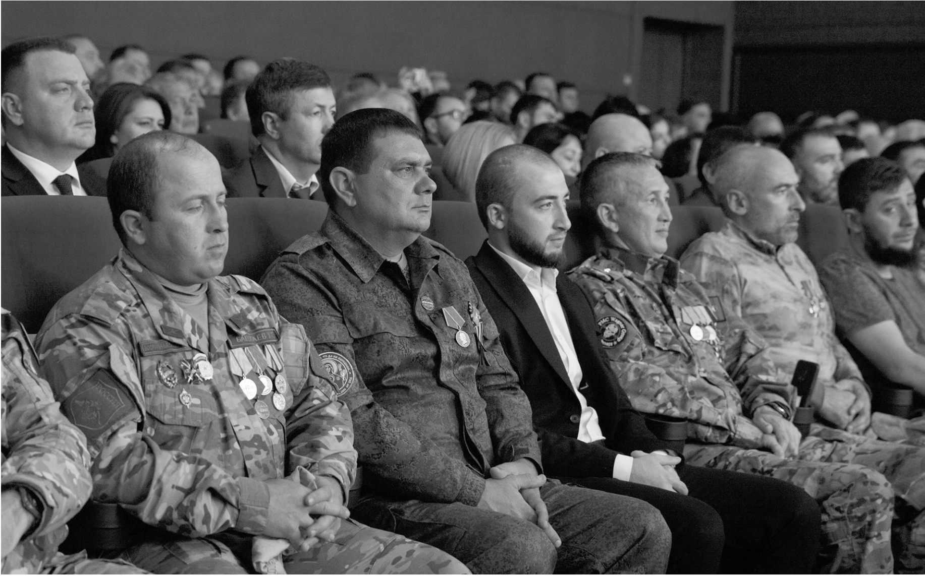
Среди собравшихся в зале на оглашение Послания Главы КЧР было немало участников СВО

За последние два года в регио-не реализовано пять крупных инвестпроектов, включая за-пуск линии по производству пряжи. Лёгкая промышлен-