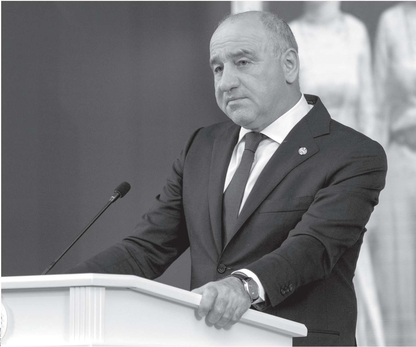
Рашид Темрезов выступает с ежегодным Посланием Народному Собранию КЧР

В Послании прозвучали искренние слова благодарности в адрес прежнего состава Народного Собрания, в котором трудился многие заслуженные депутаты.